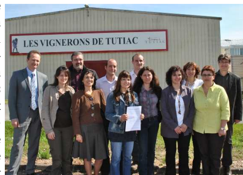
Les Délégués du Personnel brandissent la Charte éthique et sociale de l'entreprise !