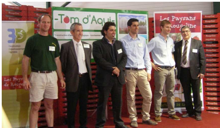
Inauguration de la serre de Parentis en Born

Du 1er au 8 avril, 10 entreprises 3D ont ouvert leurs portes à leurs parties prenantes sur le thème de la Responsabilité Sociétale. Signature officielle de la Charte Ethique et Sociale chez les Vignerons de Tutiac, inauguration de la serre écologique de Parentis-en-Born pour Tom d'Aqui et Rougeline, visite des vergers d'Unicoque sur le thème de la Biodiversité, ... et bien d'autres : Vignerons VLDC et Union Prodiffu, Unidor, Union de producteurs de Lugon, Vignerons Landais, Château Larose Trintaudon ! Les participants ont pu comprendre et apprécier concrètement l'intégration du développement durable au quotidien dans le fonctionnement de l'entreprise.