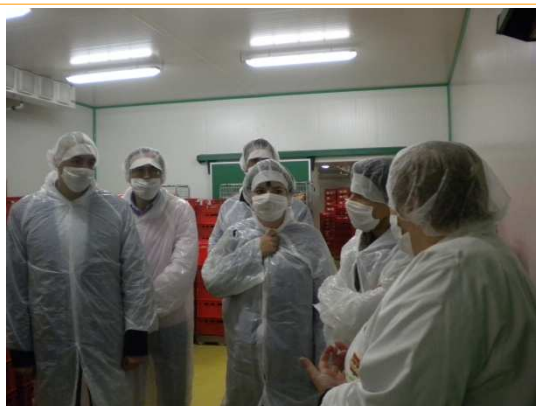
Visite des Boucheries André