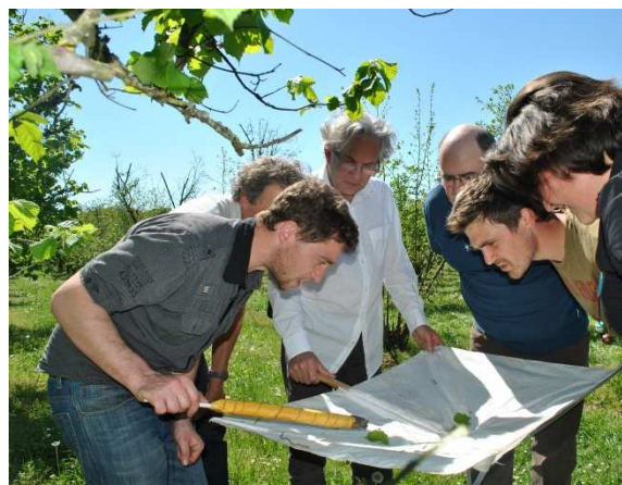
Visite des vergers d'Unicoque